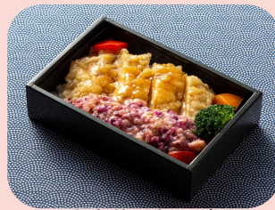
チキン南蛮丼～あけぼのタルタル添え～ Chicken Namban Rice Bowl served with Sunrise Tartar Sauce ข้าวหน้าไก่ส้มบั๊ง ~ราดซอสทาร์ทาร์สีชมพูอมส้ม~ 1600JPY / 455THB