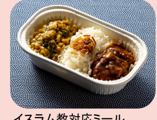
イスラム教対応ミール Halal Meal อาหารรองรับศาสนาอิสลาม 1600JPY / 455THB

各種料金は、旅程の第1区間の出発国で設定している料金および通貨が適用されます。Prices are set in accordance with the country of departure of the first segment of your itinerary, and must be paid in that currency. ค่าธรรมเนียมและค่าบริการกำหนดตามประเทศต้นทางของแผนการเดินทาง ส่วนแรก และต้องชำระเป็นสกุลเงินนั้น