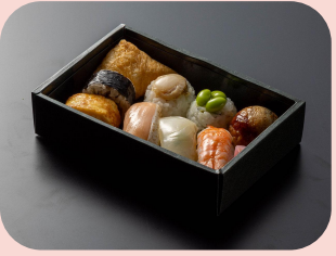
寿司ものがたり Sushi Box ~ omakase style ~ ซูชิกล่องสไตล์โอมาคาเสะ 2000JPY / 570THB