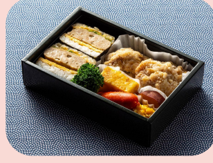
おむすび弁当 Omusubi Rice Ball Bento ข้าวกล่องโอมูซุชิเป็นโต 1500JPY / 430THB