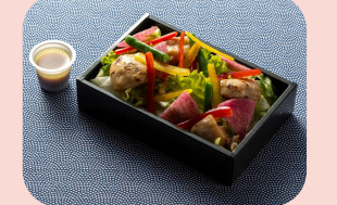
チキンと紅芯大根の野菜たっぷりサラダ～バルサミコドレッシング～ Grilled chicken salad with balsamic dressing สลัดไก่ย่าง ~น้ำสลัดบัลซามิก~ 1600JPY / 455THB