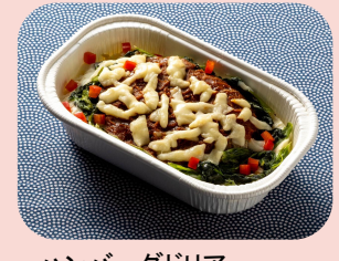
ハンバーグドリア Hamburger steak with rice gratin สเต็กแฮมเบิร์กกับข้าวกราแตง 1400JPY / 400THB