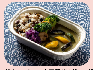
グリーンカレーと五穀米 (ヴィーガン対応) Green Curry (Vegan) แกงเขียวหวาน (มังสวิรัติ) 1600JPY / 455THB