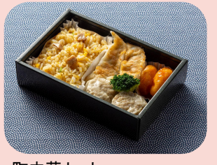
町中華セット Chinese Box ~ Japanese Style ~ กล่องจีน ~สไตล์ญี่ปุ่น~ 1500JPY / 430THB