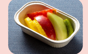
フルーツ Fresh Fruits ผลไม้สด 800JPY / 230THB

※事前購入のお食事は、離陸後にお水と共に提供します。Pre-booked meals will be served after takeoff with bottled water อาหารที่จองไว้ล่วงหน้าจะเสิร์ฟหลังเครื่องขึ้นพร้อมน้ำ