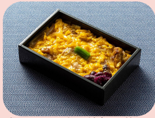
ふわとろ卵の炭火焼親子丼 Charcoal-grilled Chicken Rice Bowl with Fluffy and Creamy Egg โอเฌย่างด้วยไฟถ่าน 1600JPY / 455THB