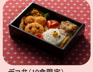
デコ弁 (10食限定) Kawaii Lunch Box (Limit to 10 meals) กล่องอาหารกลางวันคาวายิ จำกัด 10 เสริฟ 1800JPY / 515THB